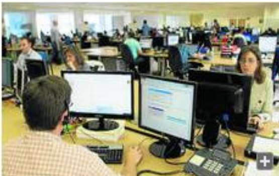
Centro de I+D en Granada