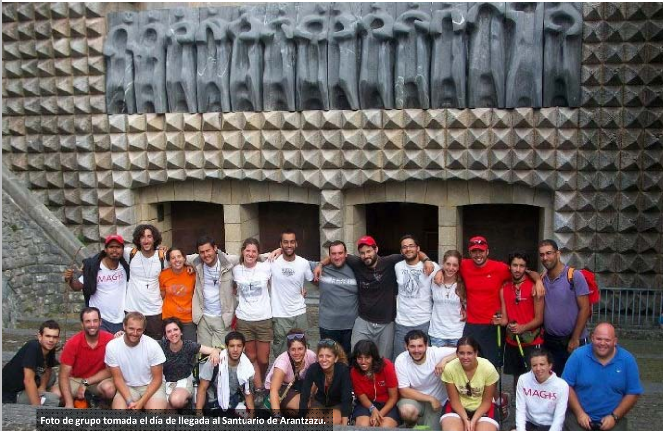
Foto de grupo tomada el día de llegada al Santuario de Arantzazu.

Nuestra jornada comenzaba, una vez listos para caminar, con un momento de oración, en el que se nos daba una pauta en torno a la que reflexionar a lo largo del día. Una vez finalizada la etapa, nos duchábamos y disfrutábamos de unas horas de tiempo libre antes de celebrar la misa y de cenar. Una de las cosas que hacíamos durante la misa tras la homilía era el Círculo Magis, en el que los peregrinos, normalmente agrupados por nacionalidades, ponían en común aquello sobre lo que habían vivido y reflexionado durante el día. Tras la cena, solíamos tener otro rato de