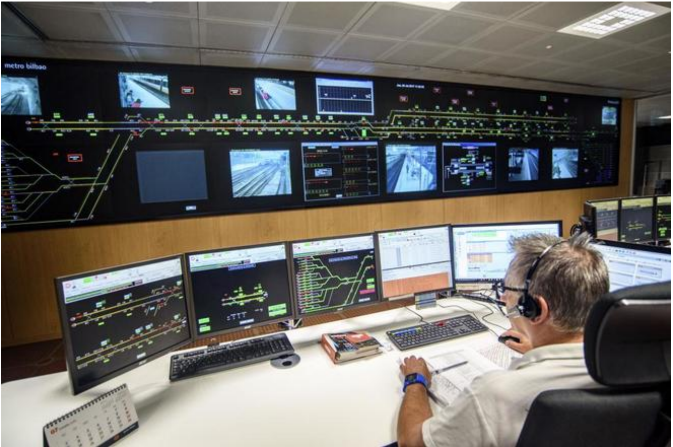
Sala de control de Metro Bilbao.

encuentran a menudo en los sectores industriales e infraestructuras catalogadas como críticas. [5]