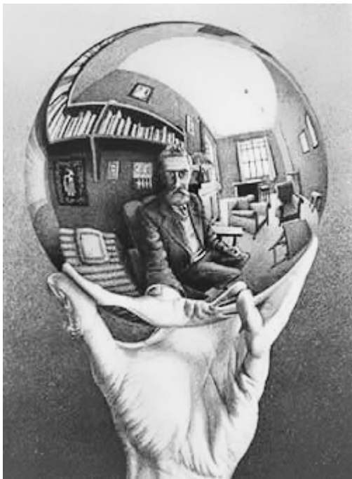
Mano con esfera reflectante (M.C. Escher, 1935)

Para concluir, quiero destacar que el cambio en el observador es de vital importancia para la transformación de las empresas, pero para lograr estabilizar dicha transformación, el cambio del observador es condición para un cambio todavía mayor: la transformación del sistema. De no tocarse el sistema, los cambios logrados a nivel de observador pueden revertirse y quedar en la nada. Ése es por lo tanto el objetivo de muchos programas de capacitación en las empresas.