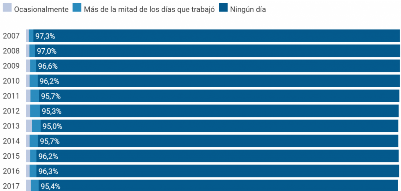
Figura 1: Porcentaje de asalariados que trabajan desde su domicilio particular, desde 2007

Esto conlleva a reflexionar en un riesgo añadido, si ellos traen y llevan sus propios dispositivos tecnológicos, toda la información de la empresa reside en dichos dispositivos y estos a su vez se conectan en diferentes redes de internet que pueden resultar inseguras, por ejemplo. Esto puede suponer que su información caiga en manos no deseadas.