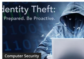
Most Important Steps to Prevent Your Organization From Identity Theft – Detailed Explanation