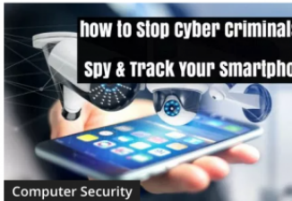
How To Stop Cyber Criminals to Spy & Track Your Smartphone