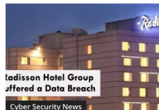
Radisson Hotel Group Data Breach Exposed Customer's Personal Data

Actualmente, no existe ninguna ley que regule los pagos realizados en ecommerces y, se puede observar que los problemas que ocurren cuando se implementan mal estas transferencias (o, directamente, no aplicar ningún tipo de control) hace 'quebrantar' leyes sobre la protección de los datos de los clientes. Vivimos en un mundo en el que las ventas online incrementan todos los años de manera continuada [9] y en el que el robo de datos está a la orden del día. Estamos en el momento propicio para crear leyes que regulen las compras (y el tráfico en general) online. Hay demasiados antecedentes en este sector como para que se empiecen a tomar medidas inmediatamente.