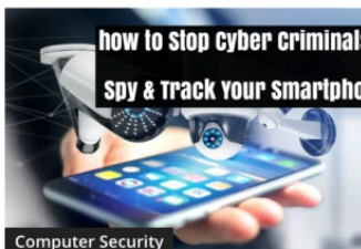
How To Stop Cyber Criminals to Spy & Track Your Smartphone