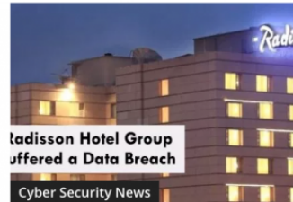
Radisson Hotel Group Data Breach Exposed Customer's Personal Data

Actualmente, no existe ninguna ley que regule los pagos realizados en ecommerces y, se puede observar que los problemas que ocurren cuando se implementan mal estas transferencias (o, directamente, no aplicar ningún tipo de control) hace ‘quebrantar’ leyes sobre la protección de los datos de los clientes. Vivimos en un mundo en el que las ventas online incrementan todos los años de manera continuada [9] y en el que el robo de datos está a la orden del día. Estamos en el momento propicio para crear leyes que regulen las compras (y el tráfico en general) online. Hay demasiados antecedentes en este sector como para que se empiecen a tomar medidas inmediatamente.