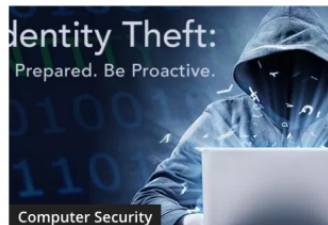
Most Important Steps to Prevent Your Organization From Identity Theft – Detailed Explanation