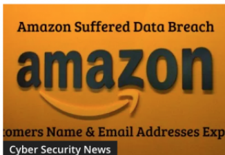
Amazon Suffered Data Breach – Customers Name & Email Addresses Exposed

Echando un vistazo en la página gbhackers [8] , ha sido muy fácil encontrar diferentes ejemplos de este problema, ¿cómo he dado con esta página? Muy sencillo, soy una persona a la que le gusta comprar maquillaje, una de las empresas americanas en las que suelo comprar es Tarte. Me he puesto a buscar fallos de esta empresa y, tras encontrarlos [9] he podido observar que este sitio guarda aun más noticias relacionadas con el estándar PCI DSS.